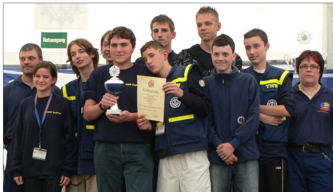
GUT PLATZIEREN konnte sich die THW-Jugendgruppe Darmstadt beim Landesjugendlager in Gelnhausen. Beim sonntäglichen Wettbewerb am 29. Juli belegten sie einen erfolgreichen 4. Platz. (Zum Bericht)

Jugend aus Dillenburg verteidigte erfolgreich ihren Titel von 2005 und wird die THW-Jugend Hessen im Jahr 2008 beim Bundeswettbewerb vertreten. Auf Platz zwei folgte Bensheim (Kreis Bergstraße) und auf Platz 3 Neu- hof (Kreis Fulda). Knapp vorbei am Siegetreppchen belegte die Jugendgruppe aus Darmstadt einen erfolgreichen 4. Platz und steigerte somit wieder ihre Leistung in Vergleich zu dem Landesjugendwettkampf im Jahr 2005 (5. Platz) und dem Landesjugendwettkampf im Jahr 2003 (7. Platz). Für Jugendliche, die Spaß und Spannung lieben, technisch interessiert sind und dabei noch gute Freunde finden möchten, ist die THW-Jugend genau die richtige Jugendorganisation. Unter dem Motto „Spielend Helfen Lernen“ können Mädchen und Jungen im Alter von zehn bis 18 Jahren in der THW-Jugend Mitglied werden. Informationen über die Jugendgruppe in Darmstadt unter www.thw-jugend-darmstadt.de.