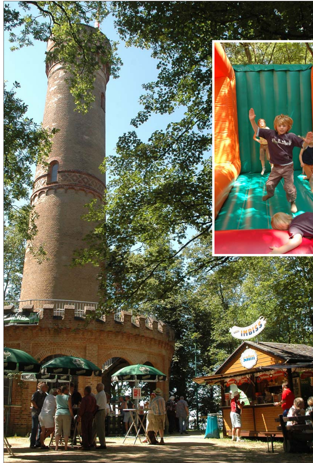
ZUM SOMMERFEST lud die Bürgeraktion Bessungen/Ludwigshöhe e.V. (BBL) anlässlich des diesjährigen Jubiläums des Ludwigsturms ein. Auf dem Bessunger Hausberg wurde am Sonntag (5.) bei bestem Sommerwetter gefeiert. Für das leibliche Wohl der zahlreichen Gäste aus nah und fern war wie immer bestens gesorgt. Die Hauptattraktionen waren eine Modenschau, Ponyreiten und das Kinderspielfest. Einen besonderen Service bot Peter Dinkel mit seinem „Heiner-Liner“ (Bild rechts). Er brachte die Gäste im Pendelverkehr vom Parkplatz Nieder-Ramstädter Straße zur Ludwigshöhe. (Zum Bericht)